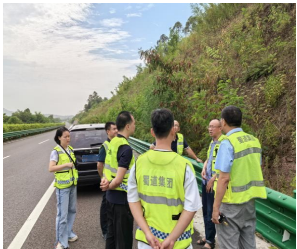
水土保持设施自主验收现场踏勘照（3）