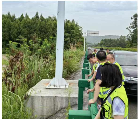
水土保持设施自主验收现场踏勘照（2）