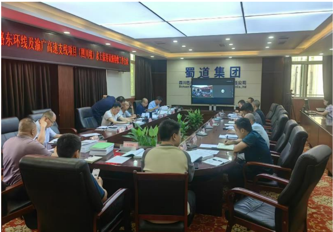
水土保持设施自主验收会议照（2）