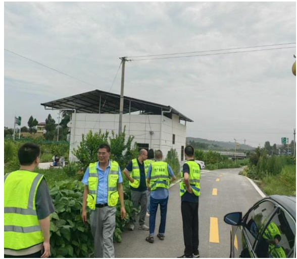
水土保持设施自主验收现场踏勘照（1）